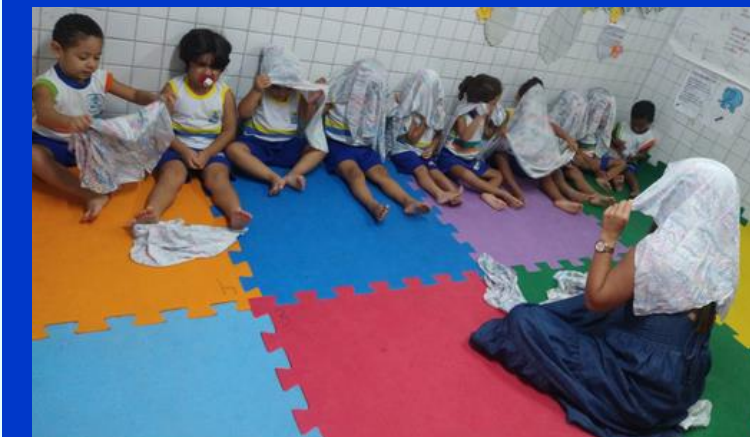
Creche Sítio Grande Profª Cybelle Souto Maior G III- 2024..