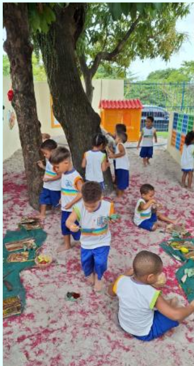
Creche Escola Dorgiane dos Santos- 2024

A partir das reações aos seus reflexos e movimentos impulsivos, a criança passa a atuar no ambiente humano, desenvolvendo aquilo que Wallon denomina motricidade expressiva, ou dimensão afetiva do movimento.